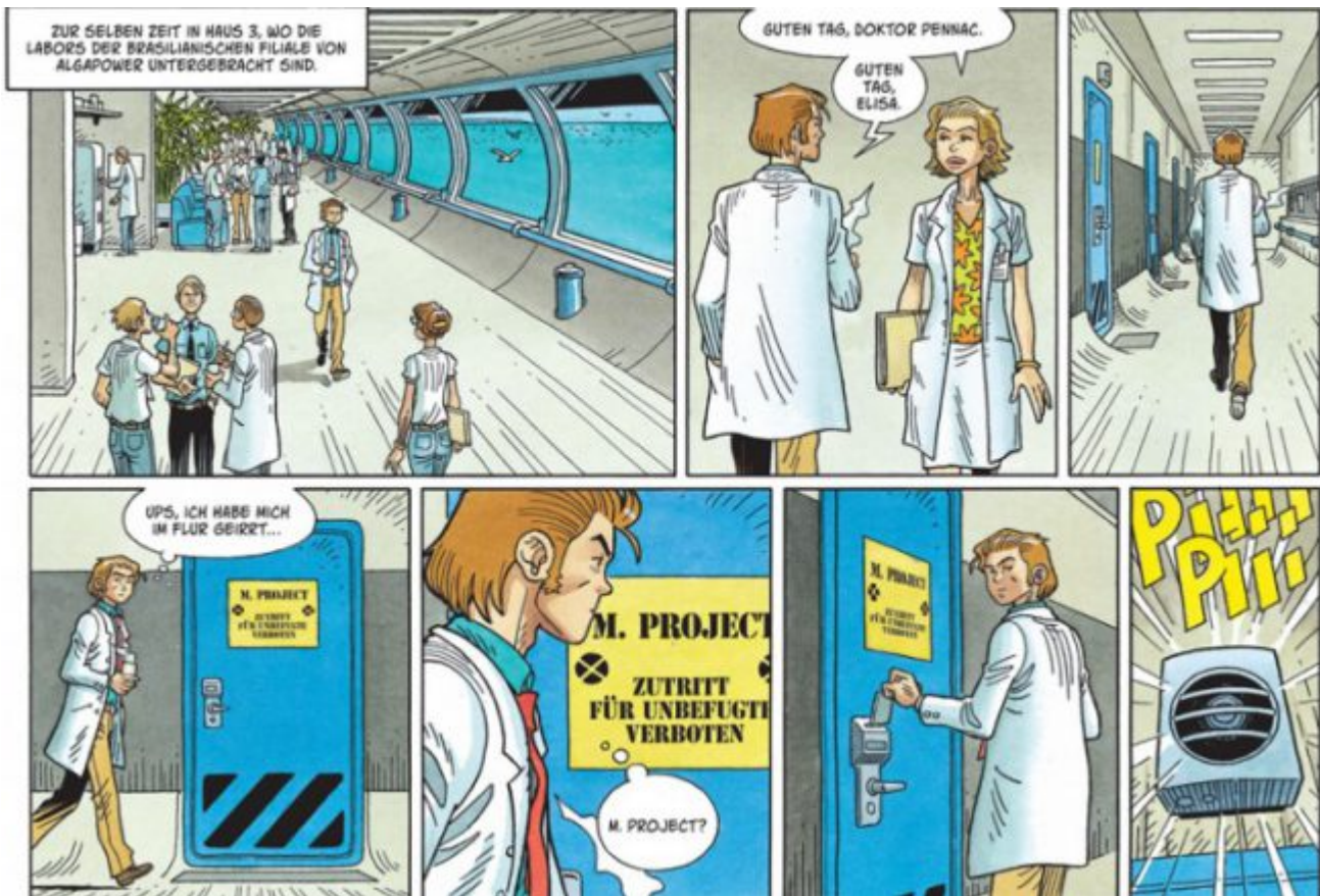
Mermaid Project Episode 3 Ausschnitt Seite 8