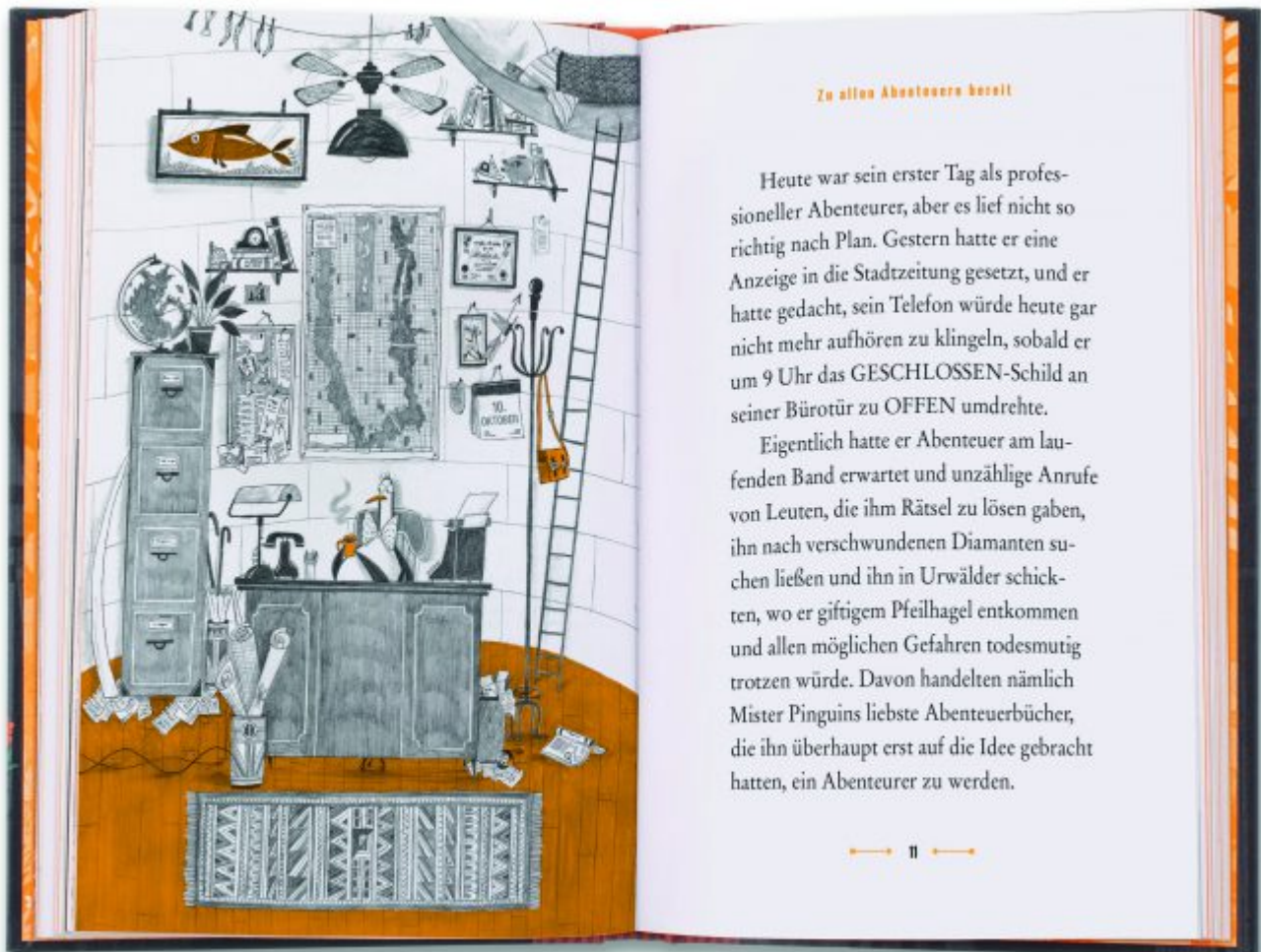
Mr. Pinguin (1), Seite 10-11