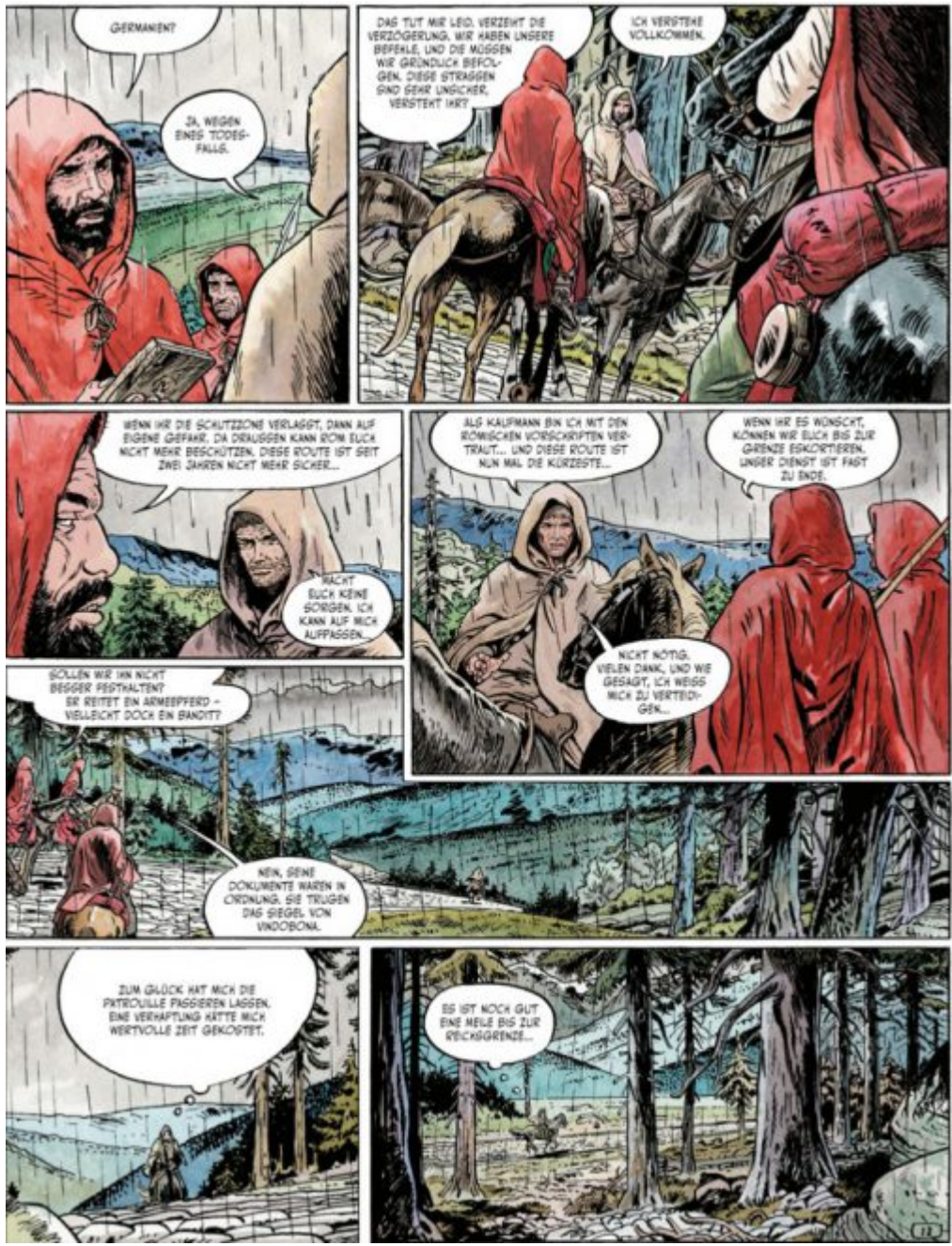
Leseprobe Auguria 1, Seite 14

Beim Lesen erinnerten mich Nuytens Zeichnungen an die in den Illustrierten Klassikern (bsv Verlag, 1956-1972). Mir waren trotz des großen Detailreichtums dann aber doch zu viele kämpfende Römer auf den Seiten. Vermisst habe ich vermehrt Szenen mit den Frauen auf dem Cover, denn ich hatte auf mehr "Schamanismus" gehofft. Davon gab es für meinen