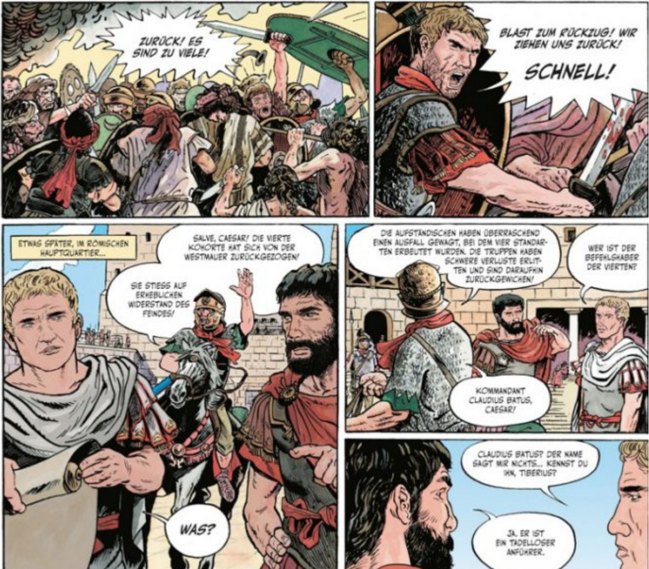
Auguria 1 Auszug Seite 5