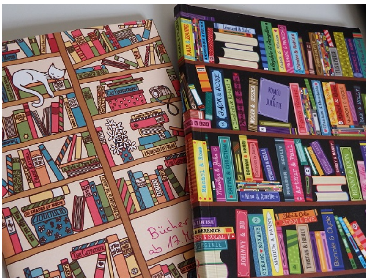
Aktuelle Lesenotizbücher. Rechts Coimcs. Links alles andere.

mir direkt nach dem Schließen des Buches Notizen. In diese fließen dann all die Emotionen, die ich nach dem Lesen loswerden muss. All die Gefühle, Nachwirkungen, Begegnungen, Gedanken. Schwierig wird es, wenn ein Text mich gar nicht berührt hat, weder positiv noch negativ. Wenn ich gar keine Empfindungen dem Gelesenen gegenüber habe. Das kommt selten vor, aber in so einem Fall versuche ich dann eben genau dieses "Gefühl" der Leere zu beschreiben. Immer aber helfen mir meine gesetzten Zettelmarkierungen. Anhand dieser kann ich zu diesen Stellen zurückgehen und sie in meinen eigenen Text einfließen lassen.