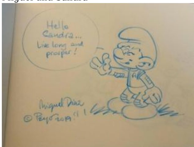
Sketch Miguel Diaz Vizoso