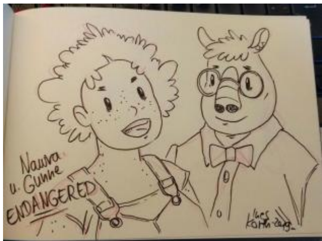
Sketch von Ines Korth - Endangered