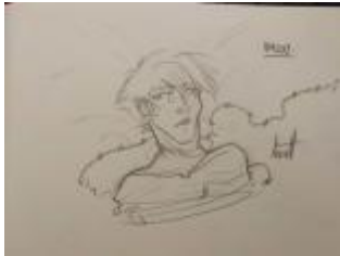
Original Art von Annette Oefner