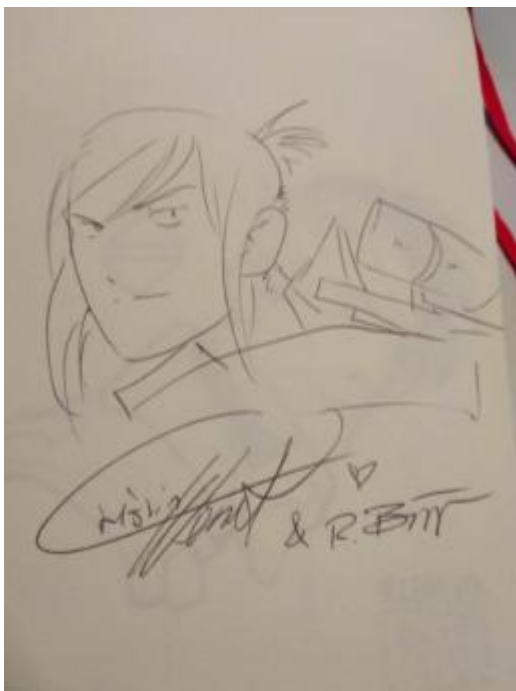
Sketch Cristin Wendt